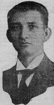
Ciudadano Lic. Don León Cortes

Los culpables de la delicada situación creada al redor de ese problema, responderán ante el juicio de la Historia por sus proceder. Que ella diga también mañana que en hora crítica para la vida económica nacional, los hombres libres y sinceros supimos cumplir con nuestro deber para el país,—levantando el alto ideal de su progreso por sobre la oscura sirte de las pasiones, en la cual jamás hemos de permitir que naufrague o peligre nuestra siempre bien amada Costa Rica.